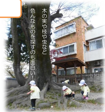
木の実は枝や虫など 色んなものを探すのも面白い！