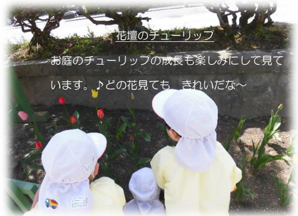
花壇のチューリップ

天気の良い日はとっても気持ちのいい場所！ おもいきり走ったり、景色を見たりと、屋上も 楽しいよ！